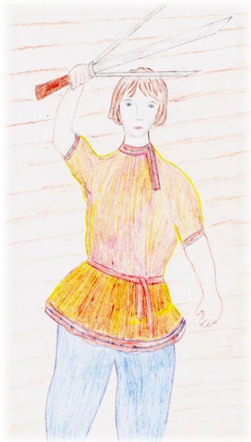
«Сковал Никита громадный меч-складенец...»

И начал богатырь следить за полётом Змея, и заметил, что в одном из местечек он неожиданно падал, мучительно корчился, а затем в отдалении с трудом выползал и подолгу лежал недвижим... И осознал Никита, что в том месте находится сила, способная пагубно действовать на Змея. И вот днями и ночами преодолевал богатырь бурные реки и речушки, поднимался на высочайшие перевалы, проходил бескрайние равнины, и, наконец, достиг нужного места, и увидел в пещерке