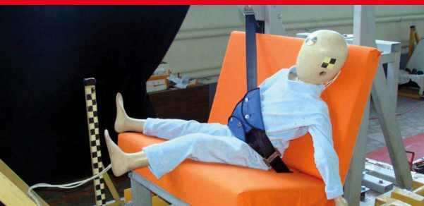
Результаты тестов использования небезопасных удерживающих устройств*

Дополнение определения «направляющая ляжка» в Правилах ЕЭК ООН № 44-04 было одобрено Всемирным Форумом (WP.29). Внесенная поправка к формулировке указывает на то, что « направляющая ляжка рассматривается как составной элемент детской удерживающей системы и НЕ может отдельно официально утверждаться в качестве детской удерживающей системы в соответствии с настоящими Правилами». Это исключает даже формальную возможность сертификации устройств типа «направляющая ляжка»!