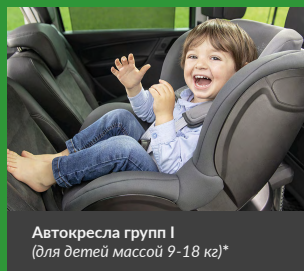
Автокресла групп I (для детей массой 9–18 кг)*