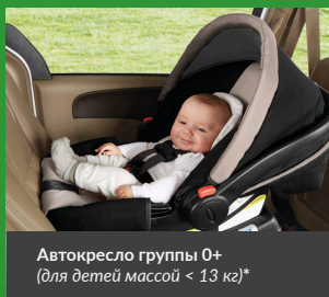
Автокресло группы 0+ (для детей массой < 13 кг)*