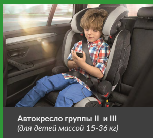
Автокресло группы II и III (для детей массой 15–36 кг)